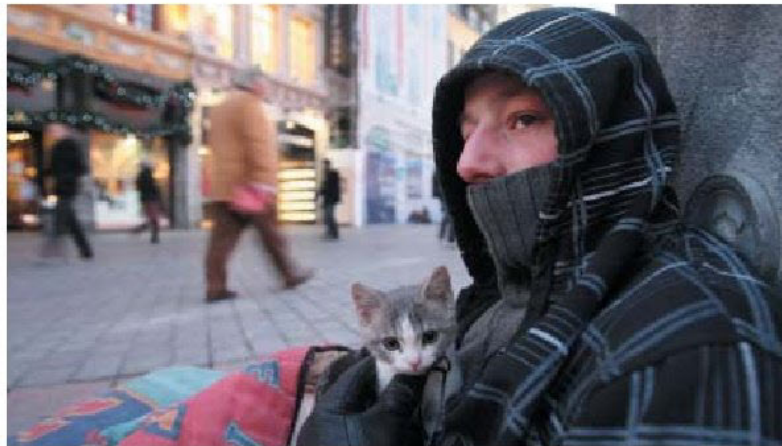
Le sac contiendra le nécessaire pour le SDF et pour son animal de compagnie.

FLORIE KONG WIN CHANG > region@nosdeclair.fr